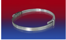
CLAMP 210 BRIDGE CLAMP